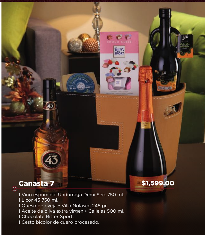
Canasta 7 $1,599.00