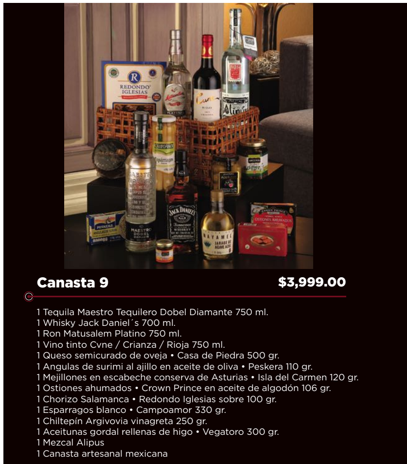
Canasta 9 $3,999.00