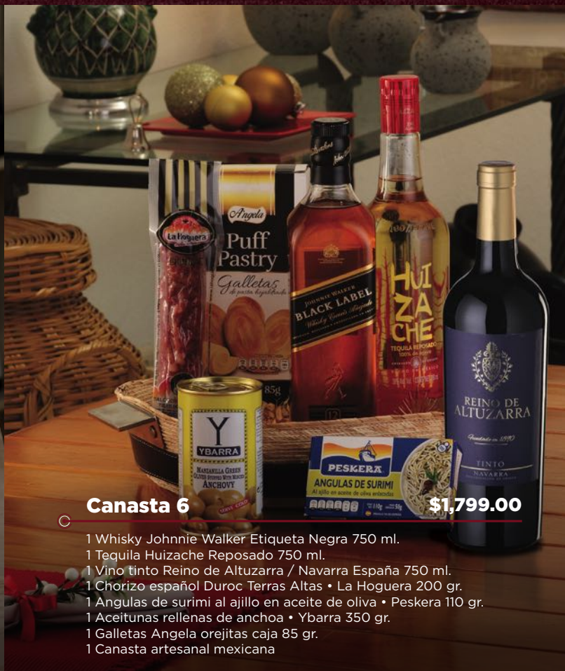
Canasta 6 $1,799.00