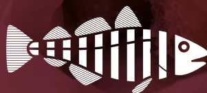
Corte en Lomos