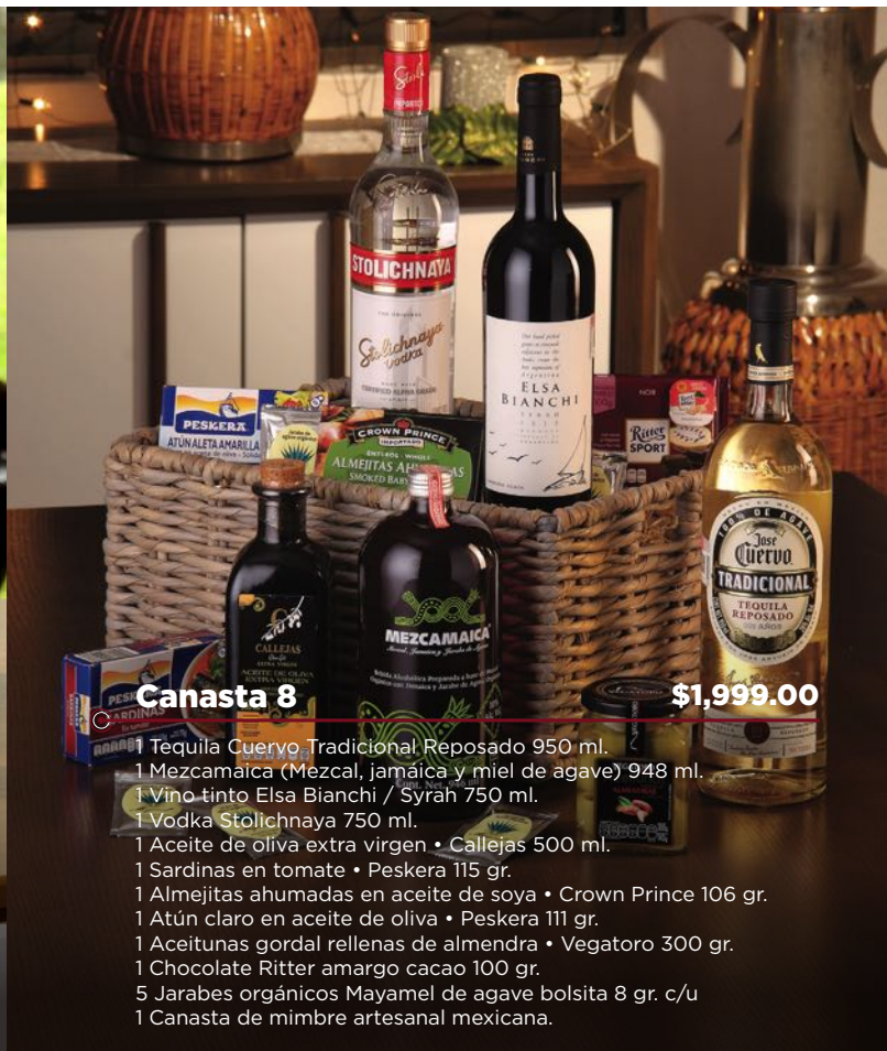
Canasta 8 $1,999.00